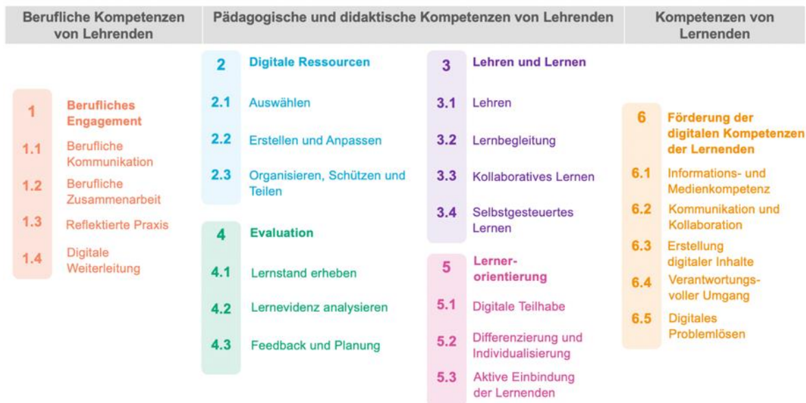
Abbildung 1: DigCompEdu: Eigene Darstellung nach Redecker und Punie (2017: 8)

Oberkategorien mit I. beruflicher Kompetenz der Lehrenden, II. pädagogischer Kompetenz der Lehrenden sowie III. Kompetenzen der Lernenden aufgeteilt und durch 6 Unterbereiche konkretisiert: 1. Berufliches Engagement, 2. Digitale Ressourcen, 3. Lehren und Lernen, 4. Evaluation, 5. Lernerorientierung, 6. Förderung der digitalen Kompetenz der Lernenden (vgl. Abb. 1).